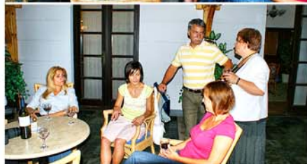
Beszámoló és képek: Ribes Attila